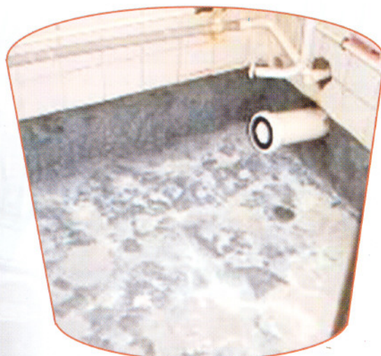
所有水務工程應交由持牌水喉匠負責