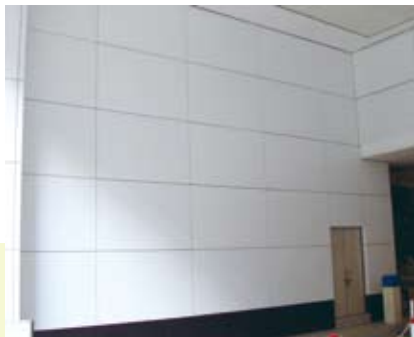
於建築物內牆壁上 以金屬暗銷及嵌固件固定的鑲板