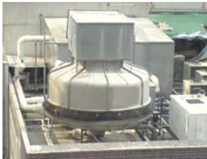
支承冷卻水塔及 相關空氣管道的構築物