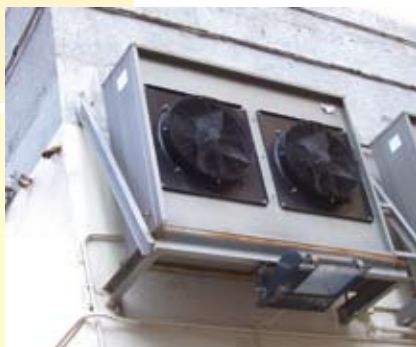
支承空調機及 相關空氣管道的金屬支架